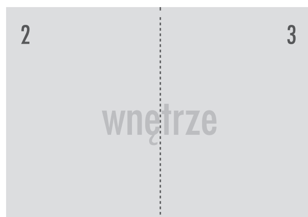
Tak wygląda ulotka przed składaniem - 2 str.